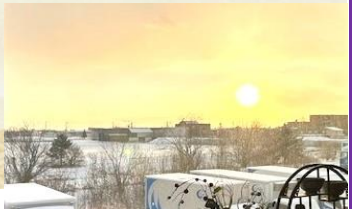
本社応接室からの初日の出

そして今年ついに大きくジャンプする年がやって来ました。まだ乗り越えなければならぬ課題はありますが社員全員が目標をもって、心を一つにして歩みを進めればきっと乗り越えて行けると信じております。我が社が一層の飛躍を遂げる為には皆さんのご協力が不可欠です。そしてそれは社員の皆さんを支えて下さるご家族の皆様の思いやご協力が有るからこそ日々感謝しております。我が社の一番の強みであるドライバーさんの感じの良さや質の高い仕事、柔軟な対応を武器として掲げ、引き続き気持ち一つにして高い志をもって邁進していきましょう。皆さんが健康で充実した一年を送られますよう祈念し私の挨拶とさせていただきます。